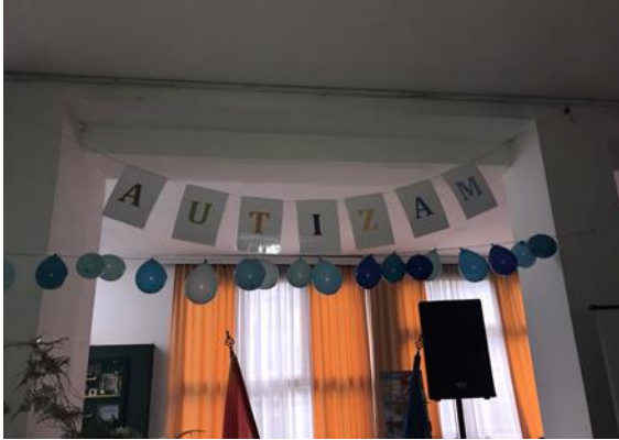
У знаку аутизма

Централно обиљежавање започело је када је Бачки парламент дијелио бецеве подршке особама са аутизмом и флајере који нас едукују како да препознамо симптоме аутизма и колико је важна вршњачка подршка.