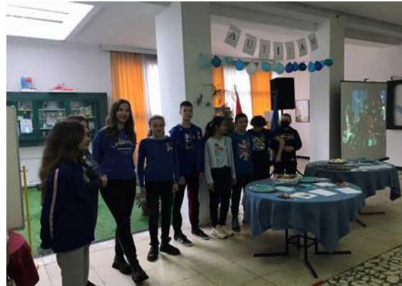
Бачки парламент ишчекује другаре